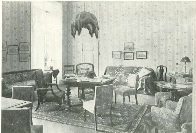
LÄS- OCH SKRIVRUM

Beställningar av rum och förfrågningar ställas till kontoret: